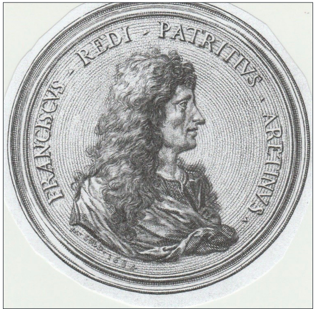
Fig. 2. Francesco Redi.

Redi era un convinto assertore dell'azione terapeutica del clistere di brodo ed il caso di Monsignor Giuseppe Ottavio Attavanti, che soffriva di disturbi renali, ce ne offre l'ulteriore riprova. Scrive l'archiatra: