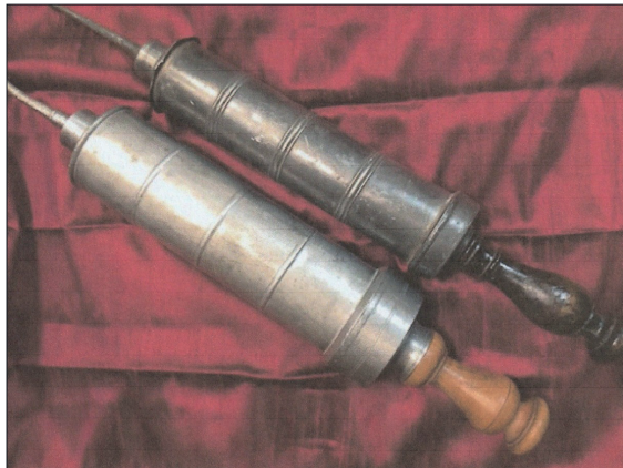
Fig. 1. Siringhe per clistere del XVIII secolo.

La pratica del clistere era nota fino dall'antichità ed attuata con una vescica, appesa in posizione elevata ed una cannula. Erodoto afferma che gli Egizi facevano di abitudine un clistere al mese per tener pulito l'intestino. Ippocrate ne consiglia l'uso periodico, per espellere gli umori nocivi e Aulo Cornelio Celso, nel De Medicina , sottolinea l'importanza del clistere, ma ne raccomanda l'uso moderato. La celebre scuola medica salernitana, fiorita nella città campana fra il X e il XIII secolo, mette in risalto, con parole esplicite, l'importanza del lavaggio intestinale, per mantenersi in salute e combattere alcune patologie: «Multoties prodest clysteria ponere ... Expedi in colica ventosa faecesque trahendo hepatis et cordis sedatur passio renum. Si cibus est crudus aut indigestio chymi aut sit apostema, vel lapsus in inferiori parte, vel ad tempus calidum, clystere retarda ... Post clystere datum patiens requiescere debet, si nihil inveniat nescit vacuare remota. Effectus varios clystere probatur habere, eius multoties communis et utilis usus ventrem mundificat, mordicat mollificatque, astringit, solidat» 2 .