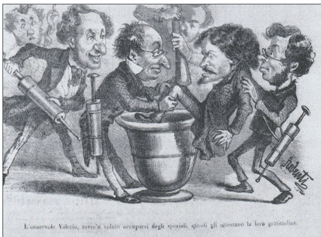
Fig. 5. Vignetta dal giornale politico “Fischietto”, 5 Marzo 1857.