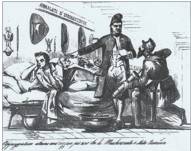
Fig. 4. Vignetta dal periodico "Don Pirlone", 3 Aprile 1849.

Gattinara descrive la siringa sotto il nome di strumento per clisteri e considerò anche necessario produrne una illustrazione ma, come la maggioranza degli inventori di quell'epoca, non osò introdurre nella pratica una così grande invenzione come proprio merito personale. Si rifugiò dietro Avicenna che l'avrebbe descritta, egli disse, ma che era stato capito male da molti. Questa dichiarazione del modesto autore ci obbliga, tuttavia, a dichiarare che non c'è assolutamente alcunché di simile in Avicenna» 22 , dato che lo strumento descritto da quest'ultimo era una semplice vescica munita di una cannula. La gloria di Gattinara ed il primato di Vercelli erano fuori discussione.