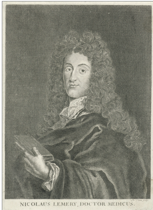
Fig. 3. Nicolas Lemery, ritratto.

Nel Malato immaginario la scena si apre con Argante, seduto ad un tavolo, che sta calcolando, con il massimo scrupolo, l'ammontare delle parcelle inviate dallo speciale Olezanti. «Tre e due cinque e cinque fanno dieci e dieci fanno venti. Tre e due cinque. In più, a partire dal giorno ventiquattro, un clisterino infiltrante, propedeutico ed emolliente, per ammorbidire, umettare e rinfrescare le viscere del signore ... Inoltre, dello stesso giorno, un buon clistere detergente, composto di doppio catholicon, rabarbaro, miele rosato e altri ingredienti, secondo prescrizione, per espurgare, lavare e pulire il basso ventre del signore, trenta soldi» 14 . Nel Medico per forza Sganarello si rivolge a Jacqueline. La donna gode di ottima salute, ma questo dato è sospetto ed è bene adottare qualche cura preventi-