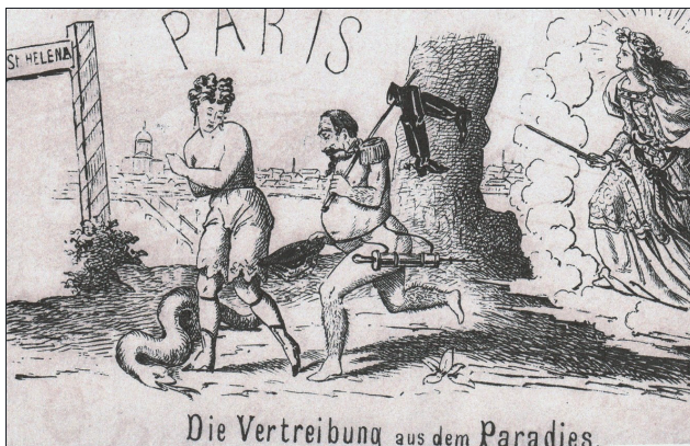
Fig. 6. Foglio volante tedesco “Bildern mit und ohne Worte” del 1870.

1870, si prendeva di mira Napoleone III, all’indomani della sconfitta di Sedan (Fig. 6). L’Imperatore, cacciato dal Paradiso, incalzato dalla Prussia, fuggiva nudo verso sant’Elena, accompagnato dalla Francia, con al fianco non la spada, ma una siringa per clistere, per purgarsi dei propri errori.